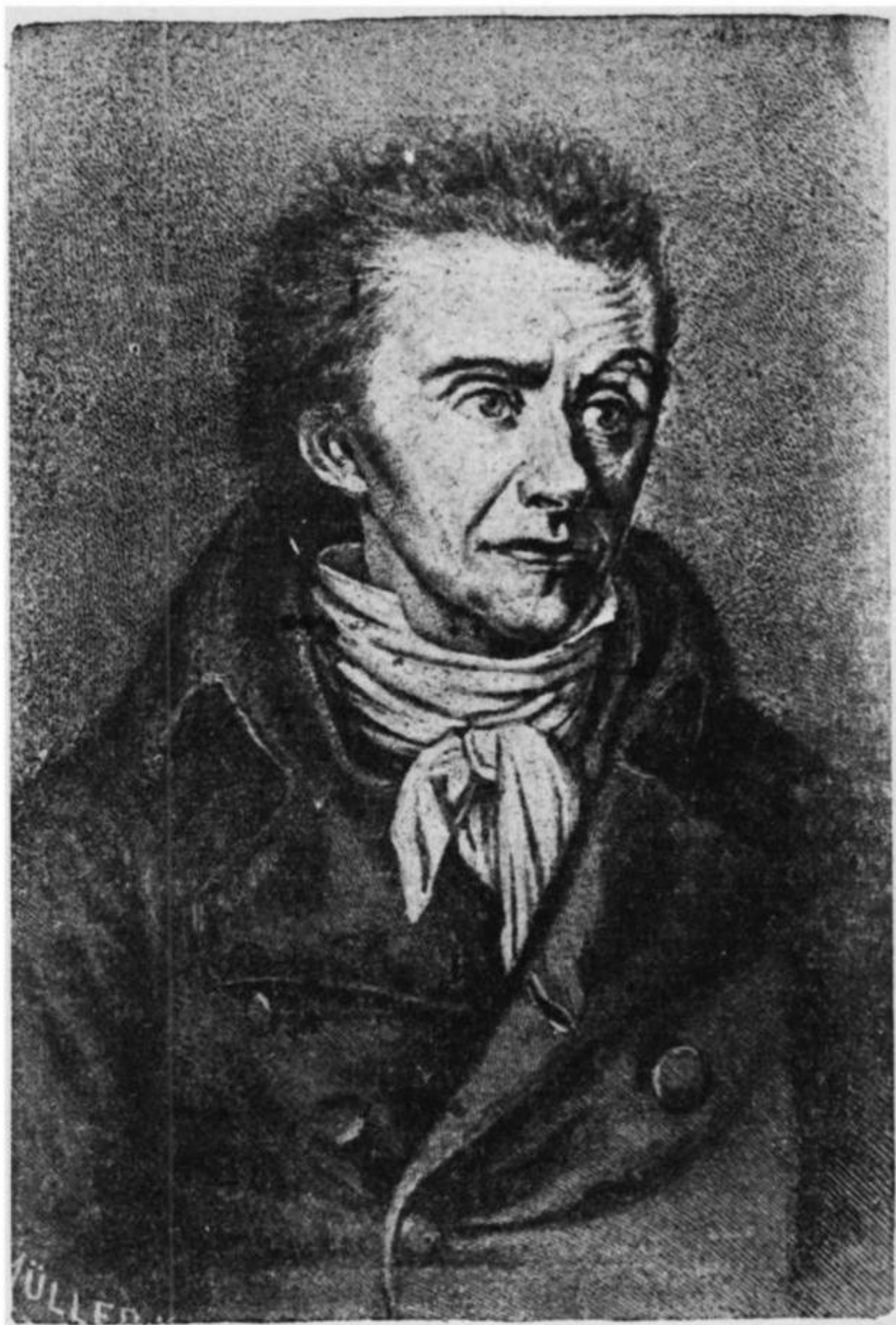
И. Г. Песталоцци в эпоху французской революции 1789 г.