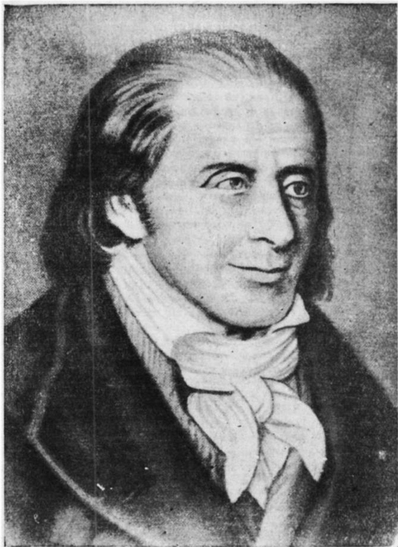
И. Г. Песталоцци