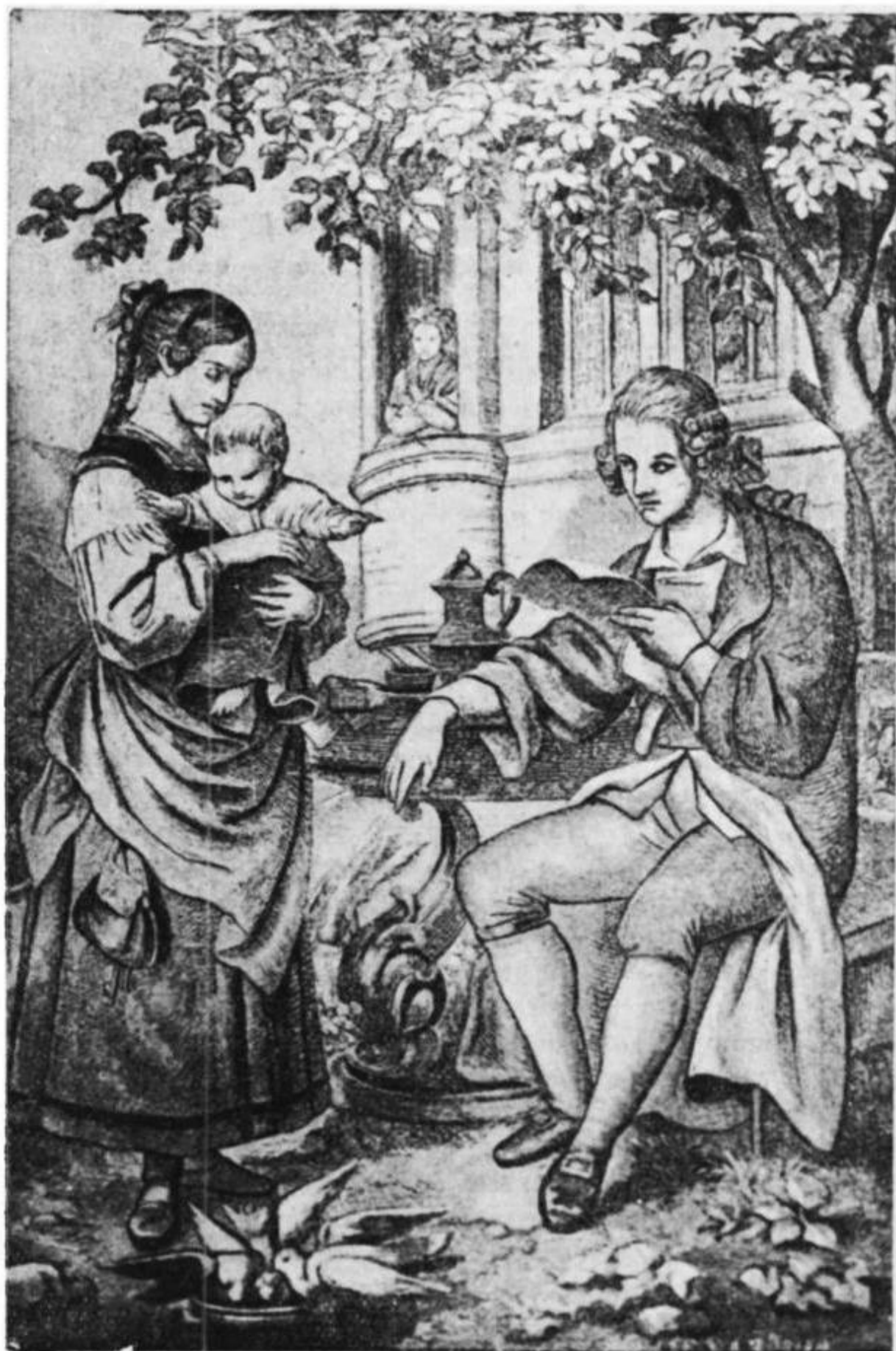
Гертруда у помещика Арнера «Лингард и Гертруда» (по одному из первых изданий)