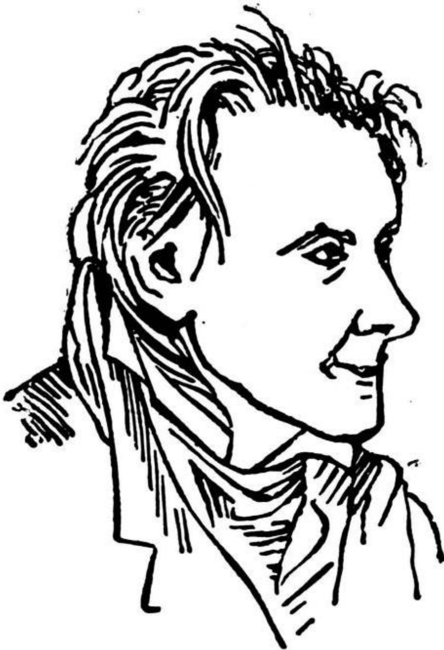
Песталоцци в молодости (по современному рисунку, Шультгеса)

спектива пробыть еще целых два года за богословскими занятиями не могла привлечь Песталоцци.