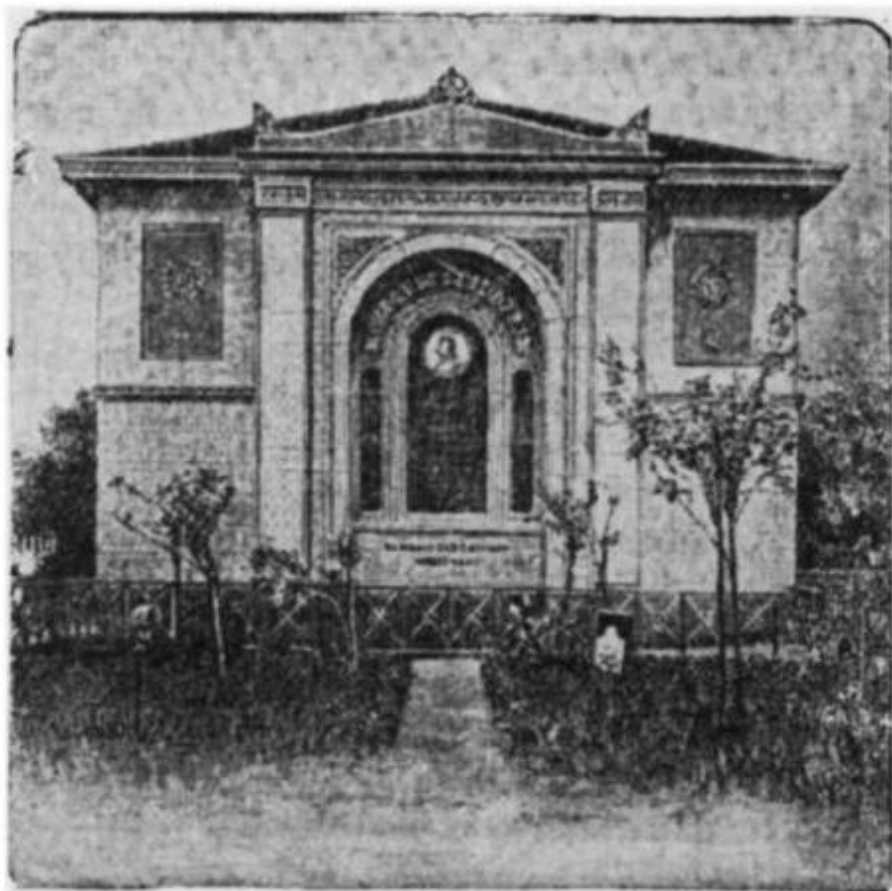
Памятник Песталоцци в Бирре

Непонятый до конца современниками, глубоко оскорбленный мелкими людьми, сводившими свои мелкие счеги, он умер одиноко, так