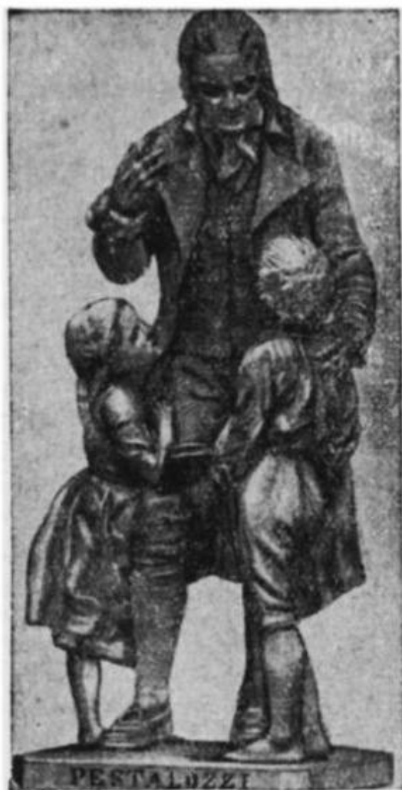
Памятник Песталоцци в Ифертене

Демократ-народник, глубокий мыслитель и педагог, замечательнейший тип энтузиаста-общественника, искренне преданный друг трудящихся не может быть чужим в Стране советов.