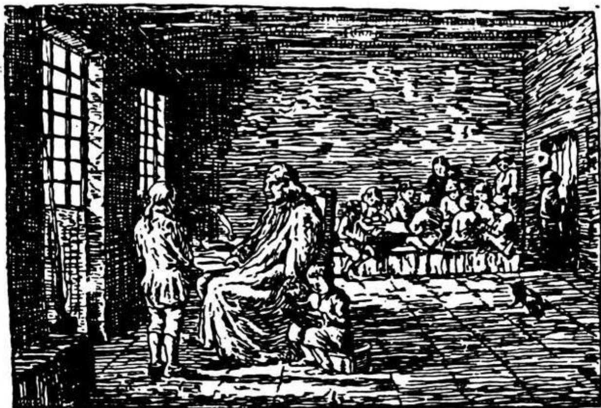
Французская школа XVIII века

Песталоцци мужественно вел настоящую борьбу против учителей, которых он не уважал. Следующий случай, описанный им самим, достаточно характеризует его в этом отношении.