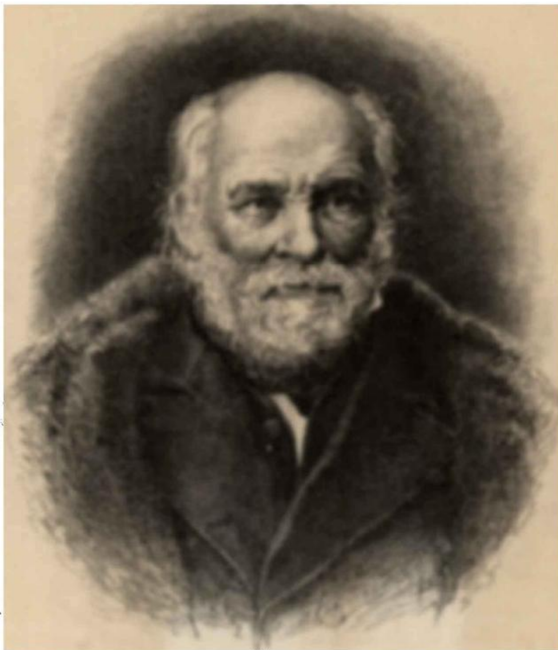
НИКОЛАЙ ИВАНОВИЧЪ ПИРОГОВЪ.