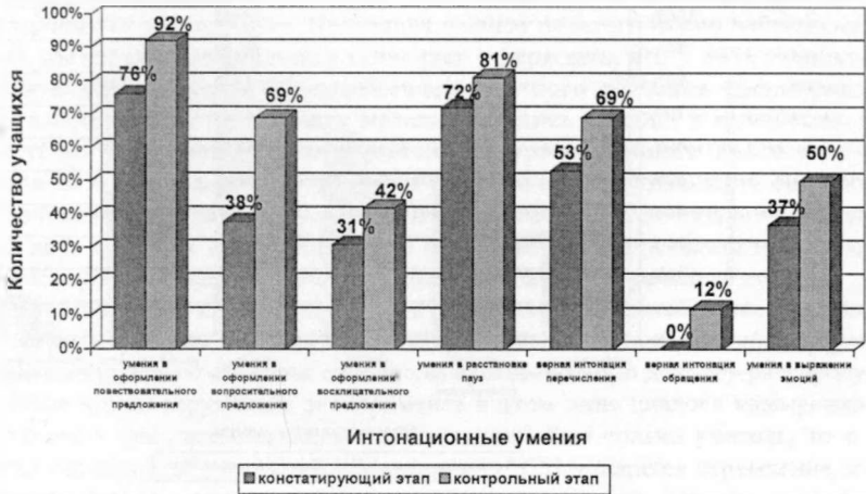
Гистограмма № 2. Сопоставительная характеристика интонационных умений учащихся на этапах констатирующего и контрольного эксперимента

Сопоставление данных констатирующего и контрольного экспериментов позволяет сделать выводы: уровень владения диалогическими и интонационными умениями у учащихся экспериментального класса значительно повысился; в контрольном классе подобные качественные изменения не выявлены. Сказанное позволяет заключить, что экспериментальная методика, в основе которой лежит идея комплексного использования приема создания речевой ситуации и приема анализа звучащих образцов, является эффективной в отношении совершенствования интонационной выразительности диалогической речи учащихся.