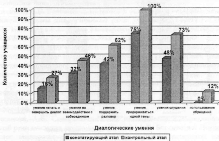
Гистограмма № 1. Сравнительная характеристика диалогических умений учащихся на этапах констатирующего и контрольного эксперимента