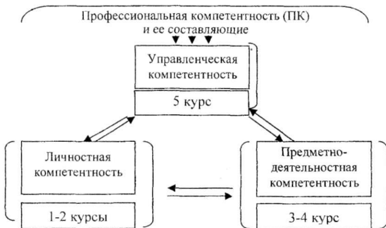
Рис. 2. Составляющие профессиональной компетентности менеджера образования

В данной главе раскрывается содержание модели и программы психологического сопровождения формирования профессиональной компетентности студентов – будущих менеджеров образования (рис. 2).