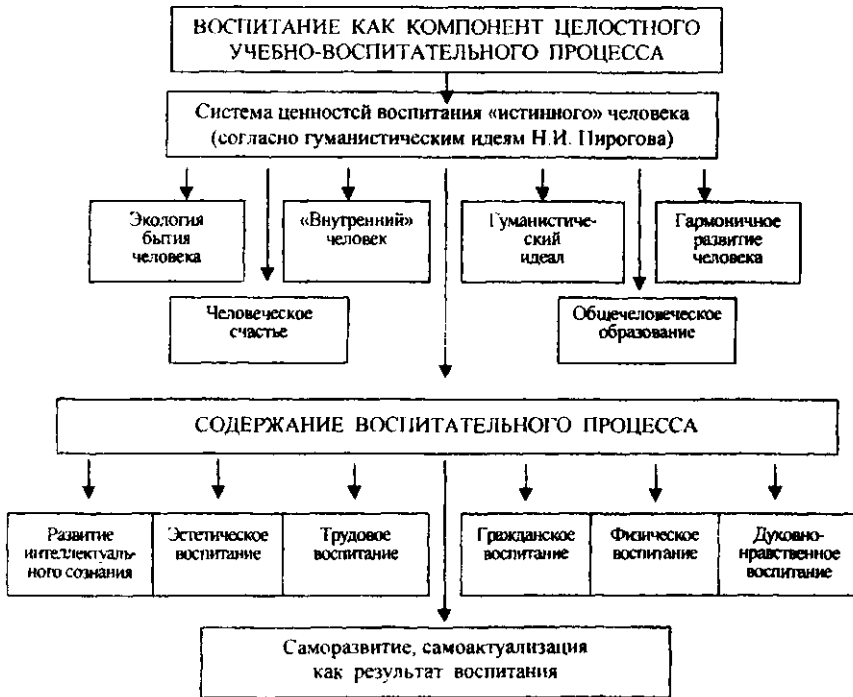
Рис. 2. Культурологическая модель воспитания «истинного» человека

Содержанием воспитательного процесса являются интеллектуальное сознание, эстетическое, трудовое, гражданское, физическое, духовно-нравственное воспитание, саморазвитие, самоактуализация как результат воспитания.