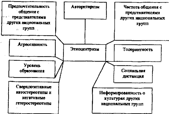
Рис. 1. Основные факторы этноцентризма.